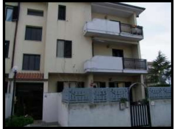
F. 08: FABBRICATO PLURIFAMILIARE UBICATO IN VIA DEGLI EUCALIPTI, N. 4, SCALA "A", IN CONTRADA DIFESA GRANDE – TERMOLI (CB), P.LLA 292