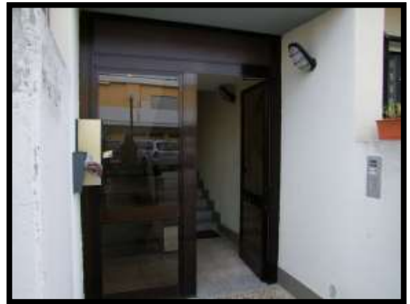
F. 10: INGRESSO COMUNE UBICATO AL PIANO TERRA IN VIA DEGLI EUCALIPTI, N. 4, SCALA "A", IN CONTRADA DIFESA GRANDE – TERMOLI (CB), P.LLA 292