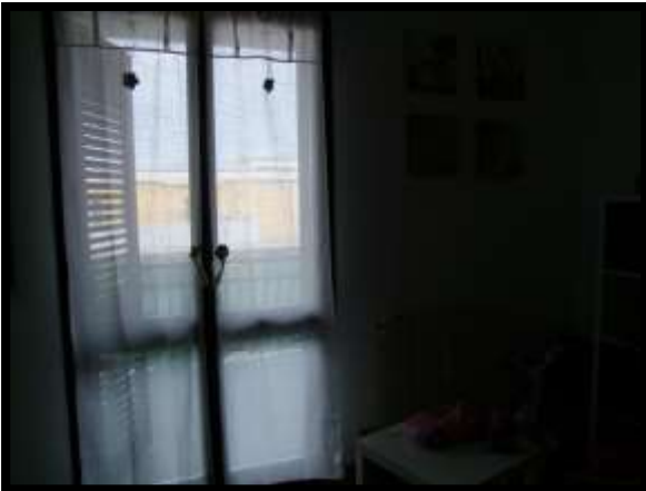
F. 15: INTERNO DELL'APPARTAMENTO INTERNO "4" UBICATO AL PIANO 1° IN VIA DEGLI EUCALIPTI, N. 4, SCALA "A", IN CONTRADA DIFESA GRANDE – TERMOLI (CB), P.LLA 292 SUB. 29 (A/2)