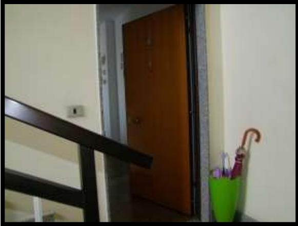
F. 13: INGRESSO DELL'APPARTAMENTO INTERNO "4" UBICATO AL PIANO 1° IN VIA DEGLI EUCALIPTI, N. 4, SCALA "A", IN CONTRADA DIFESA GRANDE – TERMOLI (CB), P.LLA 292 SUB. 29 (A/2)