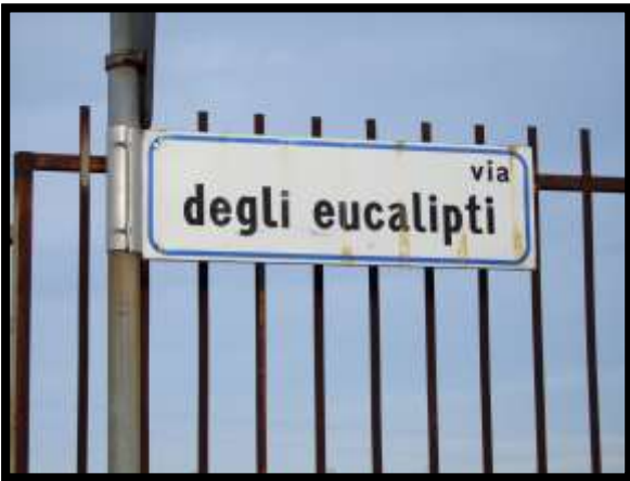
F. 03: ACCESSO AL FABBRICATO PLURIFAMILIARE DA VIA DEGLI EUALIPTI, IN CONTRADA DIFESA GRANDE, TERMOLI (CB)