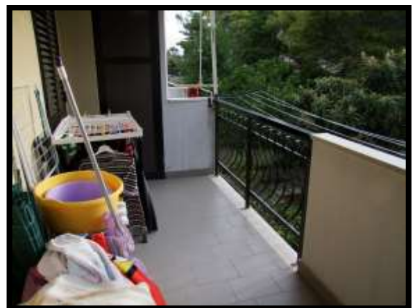
F. 24: BALCONE DELL'APPARTAMENTO INTERNO "4" UBICATO AL PIANO 1° IN VIA DEGLI EUCALIPTI, N. 4, SCALA "A", IN CONTRADA DIFESA GRANDE – TERMOLI (CB), P.LLA 292 SUB. 29 (A/2)