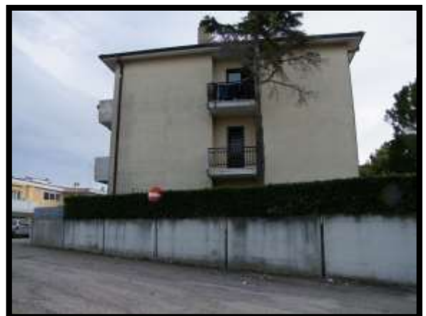
F. 06: FABBRICATO PLURIFAMILIARE UBICATO IN VIA DEGLI EUALIPTI, N. 4, IN CONTRADA DIFESA GRANDE, TERMOLI (CB), P.LLA 292