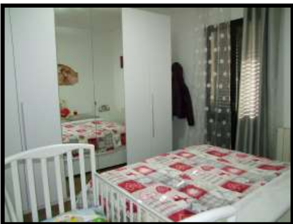
F. 23: INTERNO DELL'APPARTAMENTO INTERNO "4" UBICATO AL PIANO 1° IN VIA DEGLI EUCALIPTI, N. 4, SCALA "A", IN CONTRADA DIFESA GRANDE – TERMOLI (CB), P.LLA 292 SUB. 29 (A/2)