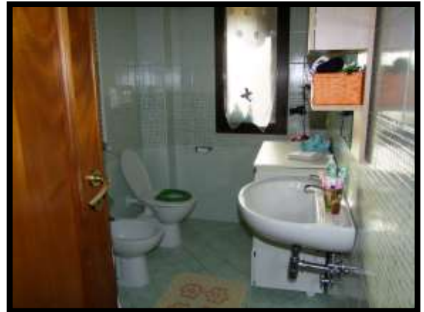
F. 22: INTERNO DELL'APPARTAMENTO INTERNO "4" UBICATO AL PIANO 1° IN VIA DEGLI EUCALIPTI, N. 4, SCALA "A", IN CONTRADA DIFESA GRANDE – TERMOLI (CB), P.LLA 292 SUB. 29 (A/2)