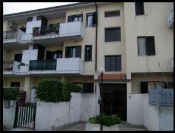
F. 07: FABBRICATO PLURIFAMILIARE UBICATO IN VIA DEGLI EUCALIPTI, N. 4, SCALA "A", IN CONTRADA DIFESA GRANDE – TERMOLI (CB), P.LLA 292