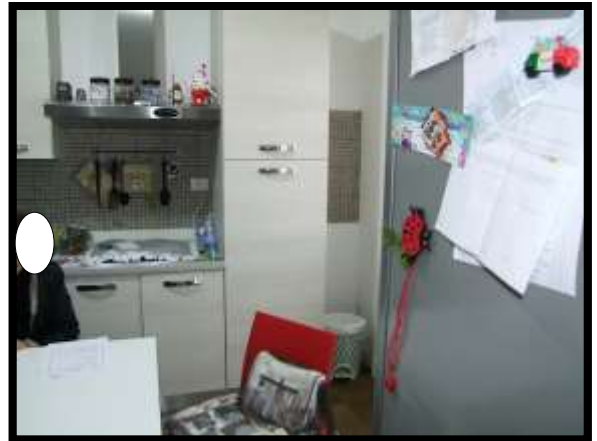
F. 16: INTERNO DELL'APPARTAMENTO INTERNO "4" UBICATO AL PIANO 1° IN VIA DEGLI EUCALIPTI, N. 4, SCALA "A", IN CONTRADA DIFESA GRANDE – TERMOLI (CB), P.LLA 292 SUB. 29 (A/2)