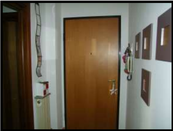
F. 27: INTERNO DELL'APPARTAMENTO INTERNO "4" UBICATO AL PIANO 1° IN VIA DEGLI EUCALIPTI, N. 4, SCALA "A", IN CONTRADA DIFESA GRANDE – TERMOLI (CB), P.LLA 292 SUB. 29 (A/2)