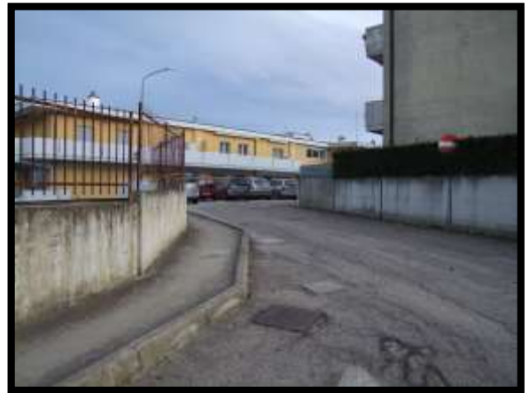
F. 04: ACCESSO AL FABBRICATO PLURIFAMILIARE DA VIA DEGLI EUALIPTI, IN CONTRADA DIFESA GRANDE, TERMOLI (CB)