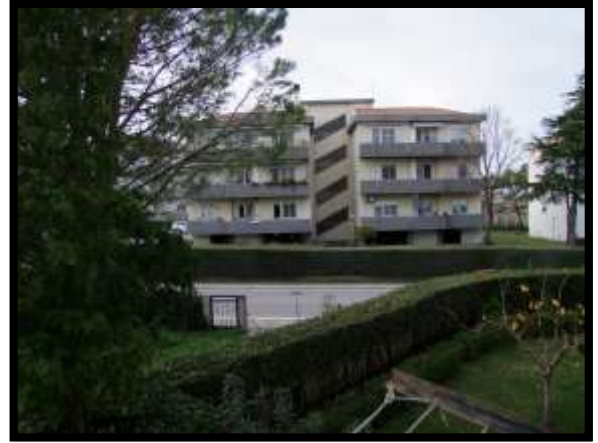
F. 26: VISTA DALL'APPARTAMENTO INTERNO "4" UBICATA AL PIANO 1° IN VIA DEGLI EUCALIPTI, N. 4, SCALA "A", IN CONTRADA DIFESA GRANDE – TERMOLI (CB), P.LLA 292 SUB. 29 (A/2)