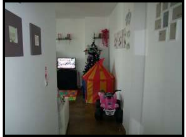
F. 14: INTERNO DELL'APPARTAMENTO INTERNO "4" UBICATO AL PIANO 1° IN VIA DEGLI EUCALIPTI, N. 4, SCALA "A", IN CONTRADA DIFESA GRANDE – TERMOLI (CB), P.LLA 292 SUB. 29 (A/2)