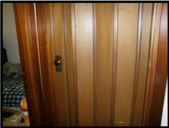
F. 21: INTERNO DELL'APPARTAMENTO INTERNO "4" UBICATO AL PIANO 1° IN VIA DEGLI EUCALIPTI, N. 4, SCALA "A", IN CONTRADA DIFESA GRANDE – TERMOLI (CB), P.LLA 292 SUB. 29 (A/2)