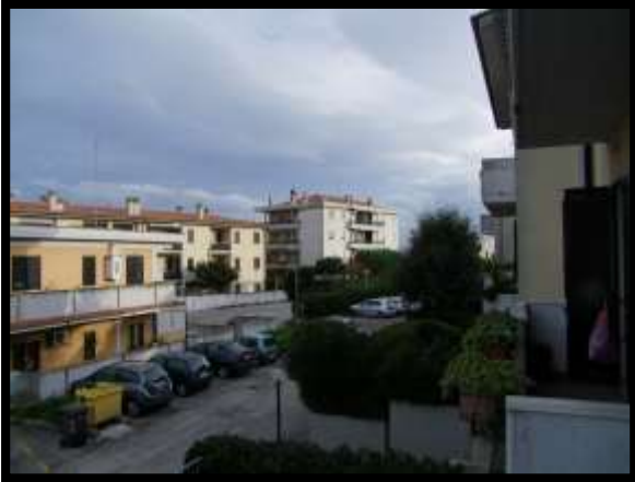
F. 19: VISTA DALL'APPARTAMENTO INTERNO "4" UBICATA AL PIANO 1° IN VIA DEGLI EUCALIPTI, N. 4, SCALA "A", IN CONTRADA DIFESA GRANDE – TERMOLI (CB), P.LLA 292 SUB. 29 (A/2)