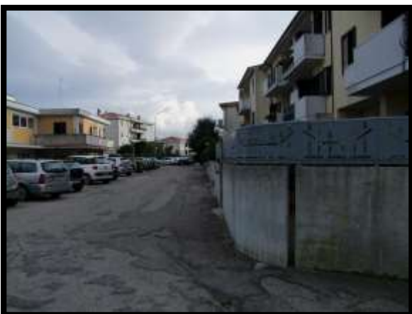
F. 05: ACCESSO AL FABBRICATO PLURIFAMILIARE DA VIA DEGLI EUALIPTI, IN CONTRADA DIFESA GRANDE, TERMOLI (CB)