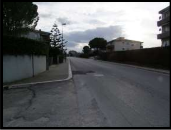
F. 01: ACCESSO AL FABBRICATO PLURIFAMILIARE DA VIA DEGLI ABETI, IN CONTRADA DIFESA GRANDE – TERMOLI (CB)