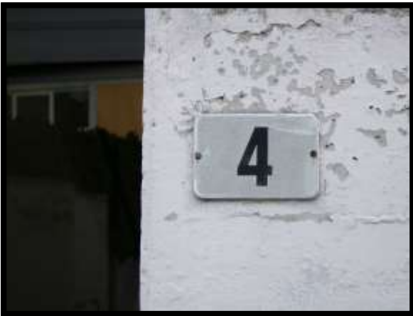
F. 09: INGRESSO COMUNE UBICATO AL PIANO TERRA IN VIA DEGLI EUCALIPTI, N. 4, SCALA "A", IN CONTRADA DIFESA GRANDE – TERMOLI (CB), P.LLA 292