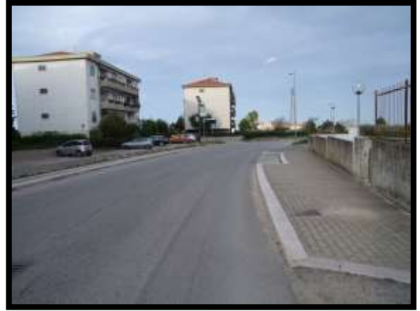
F. 02: ACCESSO AL FABBRICATO PLURIFAMILIARE DA VIA DEGLI ABETI, IN CONTRADA DIFESA GRANDE – TERMOLI (CB)