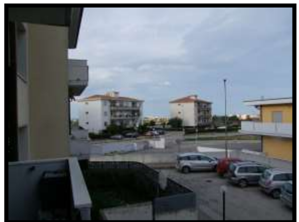
F. 18: VISTA DALL'APPARTAMENTO INTERNO "4" UBICATA AL PIANO 1° IN VIA DEGLI EUCALIPTI, N. 4, SCALA "A", IN CONTRADA DIFESA GRANDE – TERMOLI (CB), P.LLA 292 SUB. 29 (A/2)