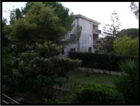
F. 25: VISTA DALL'APPARTAMENTO INTERNO "4" UBICATA AL PIANO 1° IN VIA DEGLI EUCALIPTI, N. 4, SCALA "A", IN CONTRADA DIFESA GRANDE – TERMOLI (CB), P.LLA 292 SUB. 29 (A/2)