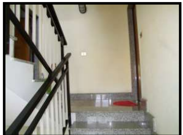
F. 12: ACCESSO ALL'APPARTAMENTO INTERNO "4" UBICATO AL PIANO 1° IN VIA DEGLI EUCALIPTI, N. 4, SCALA "A", IN CONTRADA DIFESA GRANDE – TERMOLI (CB), P.LLA 292