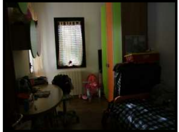
F. 20: INTERNO DELL'APPARTAMENTO INTERNO "4" UBICATO AL PIANO 1° IN VIA DEGLI EUCALIPTI, N. 4, SCALA "A", IN CONTRADA DIFESA GRANDE – TERMOLI (CB), P.LLA 292 SUB. 29 (A/2)