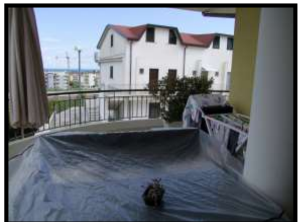
F. 12: TERRAZZO DELL'ABITAZIONE UBICATO AL PIANO TERRA IN VIA INDUSTRIALE FF.SS., N. 5, CONTRADA SELVOTTA – VASTO (CH), P.LLA 4147 SUB. 10 (A/2)