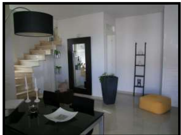
F. 06: INTERNO DELL'ABITAZIONE UBICATO AL PIANO TERRA IN VIA INDUSTRIALE FF.SS., N. 5, CONTRADA SELVOTTA – VASTO (CH), P.LLA 4147 SUB. 10 (A/2)