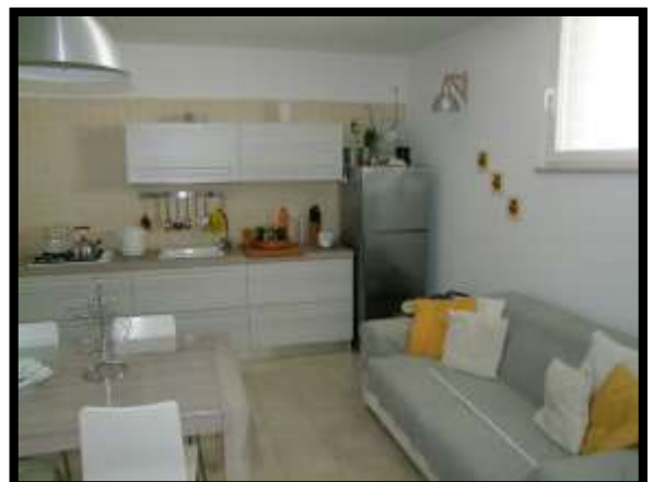
F. 18: INTERNO DELLA CANTINA UBICATA AL PIANO SOTTO-STRADA IN VIA INDUSTRIALE FF.SS., N. 5, CONTRADA SELVOTTA – VASTO (CH), P.LLA 4147 SUB. 10 (A/2)