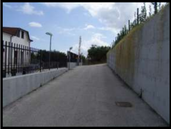
F. 01: ACCESSO AL FABBRICATO UNIFAMILIARE DALLA VIA NUCLEO INDUSTRIALE FF.SS., CONTRADA SELVOTTA, VASTO (CH)