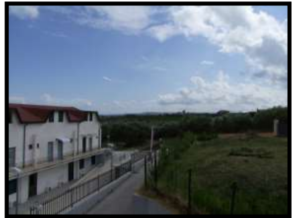
F. 28: VISTA DALL'ABITAZIONE UBICATA AL PIANO 1° IN VIA INDUSTRIALE FF.SS., N. 5, CONTRADA SELVOTTA, VASTO (CH), P.LLA 4147 SUB. 10 (A/2)