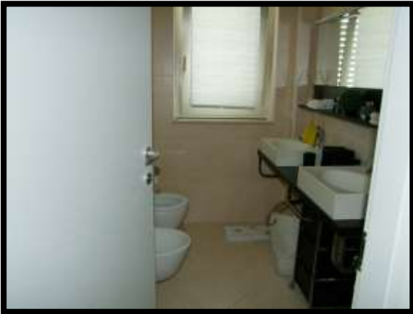
F. 09: INTERNO DELL'ABITAZIONE UBICATO AL PIANO TERRA IN VIA INDUSTRIALE FF.SS., N. 5, CONTRADA SELVOTTA – VASTO (CH), P.LLA 4147 SUB. 10 (A/2)