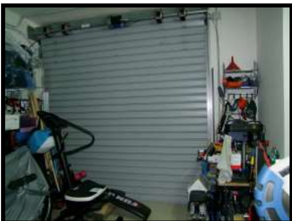
F. 23: INTERNO DEL GARAGE UBICATO AL PIANO SOTTO-STRADA IN VIA INDUSTRIALE FF.SS., N. 5, CONTRADA SELVOTTA – VASTO (CH), P.LLA 4147 SUB. 21 (C/6)