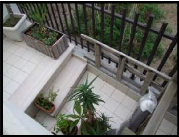
F. 15: BALCONE DELL'ABITAZIONE UBICATA AL PIANO TERRA IN VIA INDUSTRIALE FF.SS., N. 5, CONTRADA SELVOTTA – VASTO (CH), P.LLA 4147 SUB. 10 (A/2)