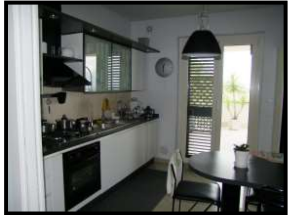
F. 10: INTERNO DELL'ABITAZIONE UBICATO AL PIANO TERRA IN VIA INDUSTRIALE FF.SS., N. 5, CONTRADA SELVOTTA – VASTO (CH), P.LLA 4147 SUB. 10 (A/2)