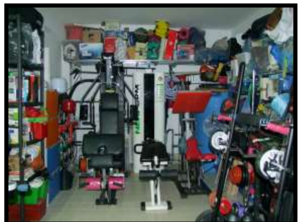
F. 24: INTERNO DEL GARAGE UBICATO AL PIANO SOTTO-STRADA IN VIA INDUSTRIALE FF.SS., N. 5, CONTRADA SELVOTTA – VASTO (CH), P.LLA 4147 SUB. 21 (C/6)