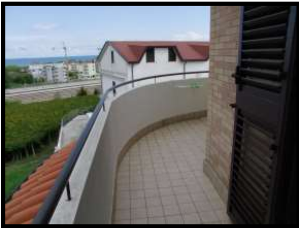
F. 33: BALCONE DELL'ABITAZIONE UBICATO AL PIANO 1° IN VIA INDUSTRIALE FF.SS., N. 5, CONTRADA SELVOTTA, VASTO (CH), P.LLA 4147 SUB. 10 (A/2)