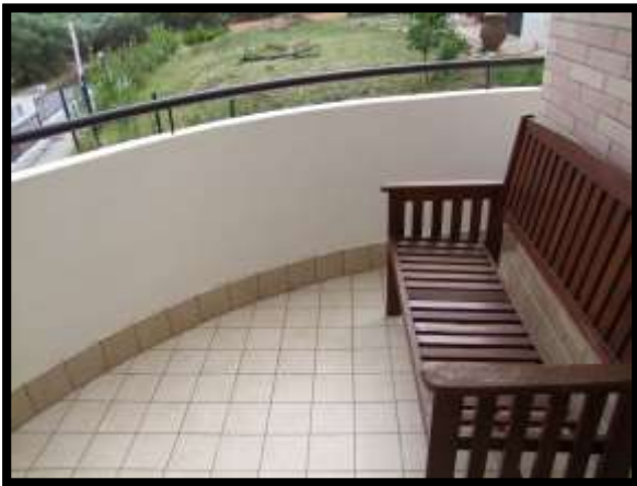
F. 27: BALCONE DELL'ABITAZIONE UBICATO AL PIANO 1° IN VIA INDUSTRIALE FF.SS., N. 5, CONTRADA SELVOTTA, VASTO (CH), P.LLA 4147 SUB. 10 (A/2)