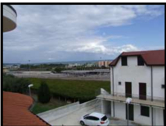
F. 29: VISTA DALL'ABITAZIONE UBICATA AL PIANO 1° IN VIA INDUSTRIALE FF.SS., N. 5, CONTRADA SELVOTTA, VASTO (CH), P.LLA 4147 SUB. 10 (A/2)