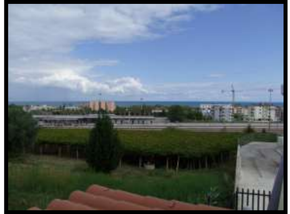
F. 14: VISTA DALL'ABITAZIONE UBICATA AL PIANO TERRA IN VIA INDUSTRIALE FF.SS., N. 5, CONTRADA SELVOTTA – VASTO (CH), P.LLA 4147 SUB. 10 (A/2)