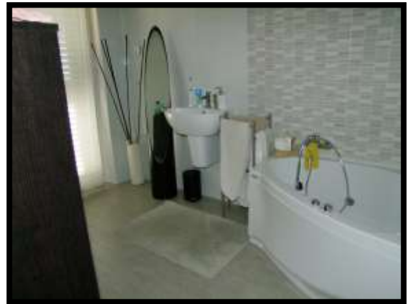
F. 34: INTERNO DELL'ABITAZIONE UBICATO AL PIANO 1° IN VIA INDUSTRIALE FF.SS., N. 5, CONTRADA SELVOTTA, VASTO (CH), P.LLA 4147 SUB. 10 (A/2)