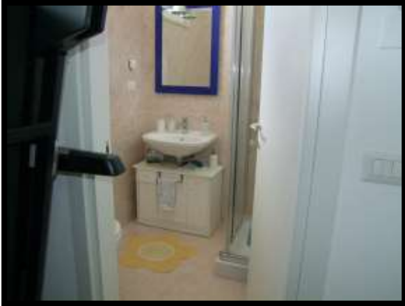
F. 19: INTERNO DEL W.C. UBICATO AL PIANO SOTTO-STRADA IN VIA INDUSTRIALE FF.SS., N. 5, CONTRADA SELVOTTA – VASTO (CH), P.LLA 4147 SUB. 10 (A/2)