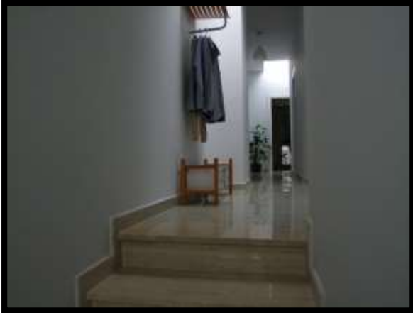
F. 25: ACCESSO ALL'ABITAZIONE UBICATA AL PIANO 1° IN VIA INDUSTRIALE FF.SS., N. 5, CONTRADA SELVOTTA, VASTO (CH), P.LLA 4147 SUB. 10 (A/2)