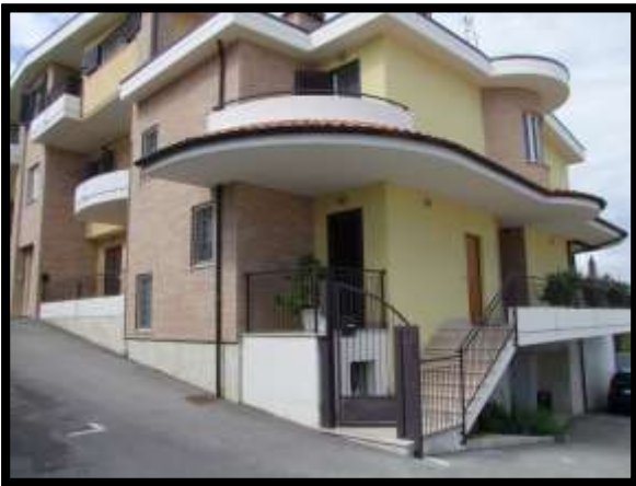
F. 03: FABBRICATO UNIFAMILIARE UBICATO IN VIA NUCLEO INDUSTRIALE FF.SS., N. 5, CONTRADA SELVOTTA – VASTO (CH), P.LLE 4147 SUB. 10 (A/2) E SUB. 21 (C/6)