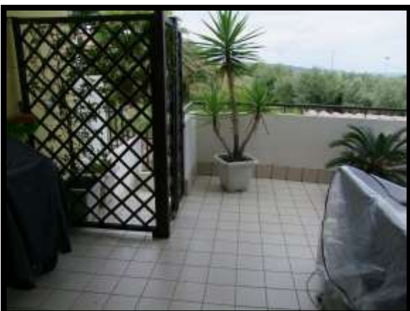
F. 11: TERRAZZO DELL'ABITAZIONE UBICATO AL PIANO TERRA IN VIA INDUSTRIALE FF.SS., N. 5, CONTRADA SELVOTTA – VASTO (CH), P.LLA 4147 SUB. 10 (A/2)