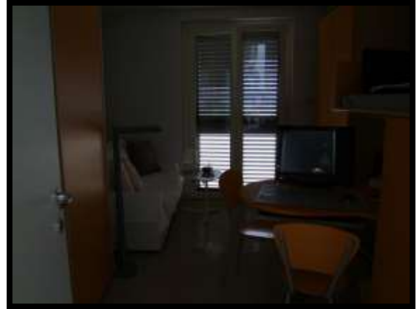
F. 32: INTERNO DELL'ABITAZIONE UBICATO AL PIANO 1° IN VIA INDUSTRIALE FF.SS., N. 5, CONTRADA SELVOTTA, VASTO (CH), P.LLA 4147 SUB. 10 (A/2)