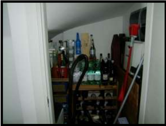
F. 21: INTERNO DEL RIPOSTIGLIO UBICATO AL PIANO SOTTO-STRADA IN VIA INDUSTRIALE FF.SS., N. 5, CONTRADA SELVOTTA – VASTO (CH), P.LLA 4147 SUB. 10 (A/2)