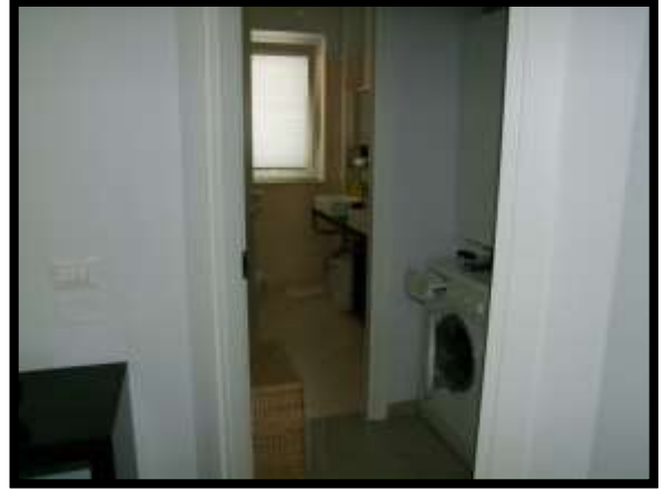
F. 08: INTERNO DELL'ABITAZIONE UBICATO AL PIANO TERRA IN VIA INDUSTRIALE FF.SS., N. 5, CONTRADA SELVOTTA – VASTO (CH), P.LLA 4147 SUB. 10 (A/2)