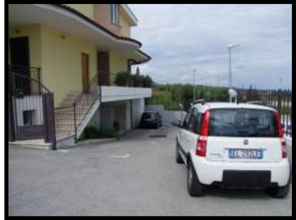
F. 02: ACCESSO AL FABBRICATO UNIFAMILIARE DALLA VIA NUCLEO INDUSTRIALE FF.SS., N. 5, CONTRADA SELVOTTA – VASTO (CH), P.LLA 4147 SUB. 5 (B.C.N.C.)