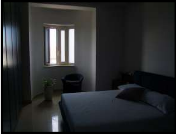
F. 31: INTERNO DELL'ABITAZIONE UBICATA AL PIANO 1° IN VIA INDUSTRIALE FF.SS., N. 5, CONTRADA SELVOTTA, VASTO (CH), P.LLA 4147 SUB. 10 (A/2)