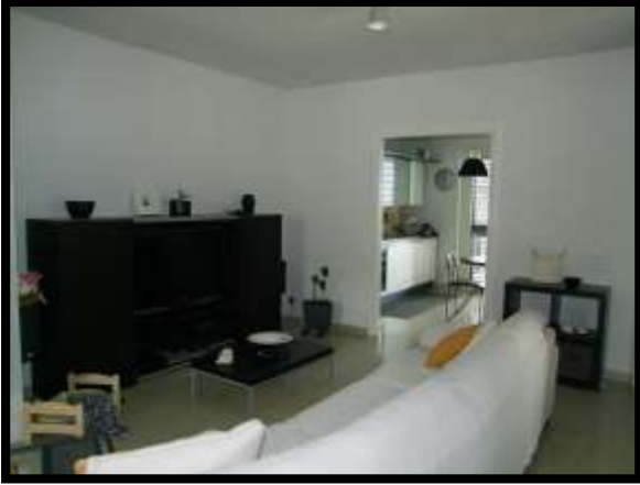
F. 07: INTERNO DELL'ABITAZIONE UBICATO AL PIANO TERRA IN VIA INDUSTRIALE FF.SS., N. 5, CONTRADA SELVOTTA – VASTO (CH), P.LLA 4147 SUB. 10 (A/2)