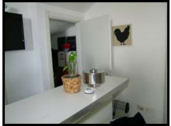
F. 20: INTERNO DELLA CANTINA UBICATO AL PIANO SOTTO-STRADA IN VIA INDUSTRIALE FF.SS., N. 5, CONTRADA SELVOTTA – VASTO (CH), P.LLA 4147 SUB. 10 (A/2)