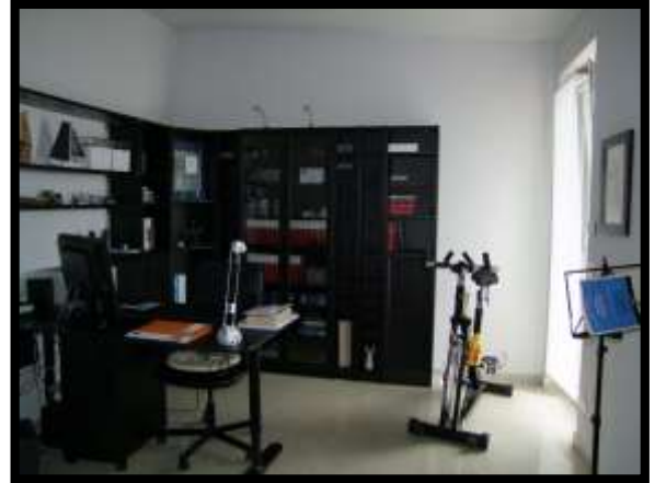
F. 26: INTERNO DELL'ABITAZIONE UBICATO AL PIANO 1° IN VIA INDUSTRIALE FF.SS., N. 5, CONTRADA SELVOTTA, VASTO (CH), P.LLA 4147 SUB. 10 (A/2)