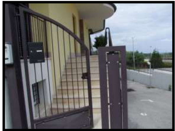
F. 04: INGRESSO DELL'ABITAZIONE UBICATO AL PIANO TERRA IN VIA INDUSTRIALE FF.SS., N. 5, CONTRADA SELVOTTA – VASTO (CH), P.LLA 4147 SUB. 10 (A/2)