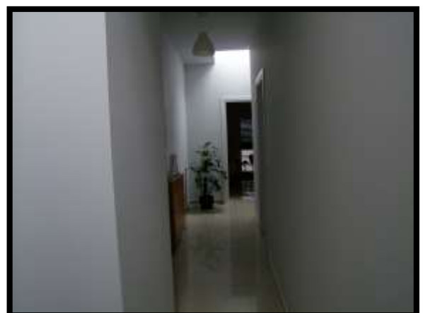
F. 30: INTERNO DELL'ABITAZIONE UBICATO AL PIANO 1° IN VIA INDUSTRIALE FF.SS., N. 5, CONTRADA SELVOTTA, VASTO (CH), P.LLA 4147 SUB. 10 (A/2)