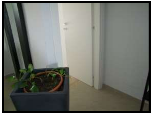
F. 16: INTERNO DELL'ABITAZIONE UBICATA AL PIANO TERRA IN VIA INDUSTRIALE FF.SS., N. 5, CONTRADA SELVOTTA – VASTO (CH), P.LLA 4147 SUB. 10 (A/2)