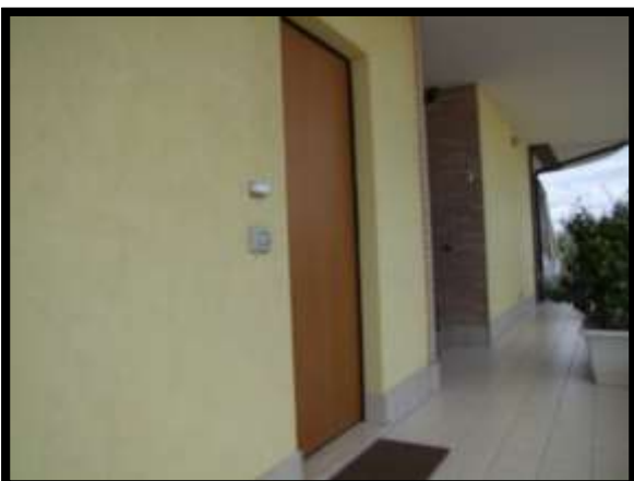
F. 05: INGRESSO DELL'ABITAZIONE UBICATO AL PIANO TERRA IN VIA INDUSTRIALE FF.SS., N. 5, CONTRADA SELVOTTA – VASTO (CH), P.LLA 4147 SUB. 10 (A/2)