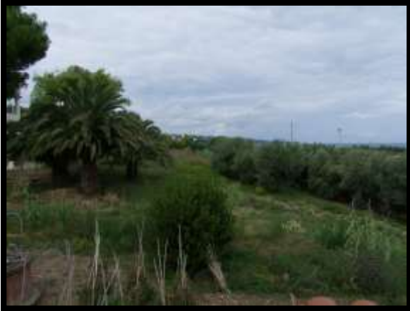
F. 13: VISTA DALL'ABITAZIONE UBICATA AL PIANO TERRA IN VIA INDUSTRIALE FF.SS., N. 5, CONTRADA SELVOTTA – VASTO (CH), P.LLA 4147 SUB. 10 (A/2)