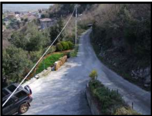
F. 11: VISTA DALL'APPARTAMENTO UBICATA AL PIANO 1° (PIANO 2° CATASTALE) IN VIA LEONARDO DA VINCI, N. 16 – MONTAQUILA (IS)