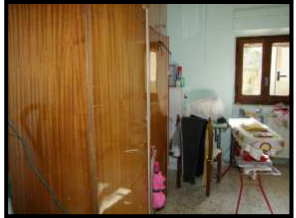
F. 32: INTERNO DELL'APPARTAMENTO UBICATO AL PIANO TERRA (PIANO 1° CATASTALE) IN VIA LEONARDO DA VINCI, N. 16 – MONTAQUILA (IS), P.LLA 3 SUB. 7 (A/2)