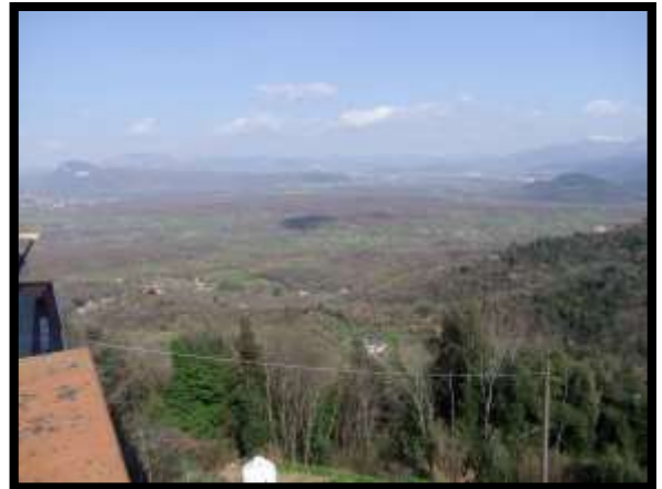
F. 10: VISTA DALL'APPARTAMENTO UBICATA AL PIANO 1° (PIANO 2° CATASTALE) IN VIA LEONARDO DA VINCI, N. 16 – MONTAQUILA (IS)