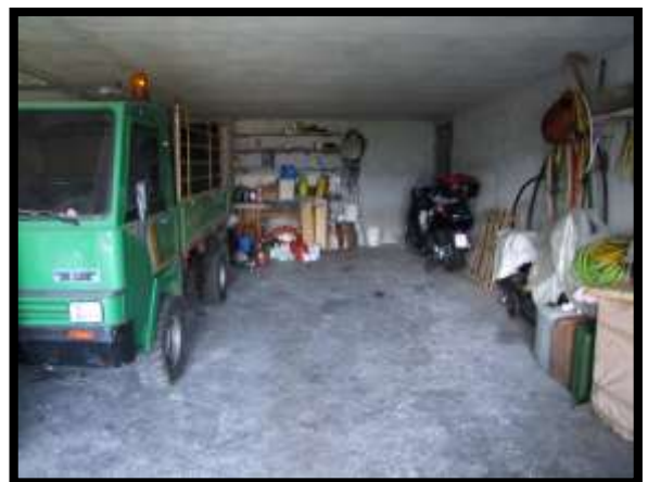
F. 54: INTERNO DEL GARAGE UBICATO A PIANO SEMINTERRATO 2 (PIANO SEMINTERRATO 1 CATASTALE) IN VIA LEONARDO DA VINCI, N. 16 – MONTAQUILA (IS), P.LLA 3 SUB. 6 (C/6)