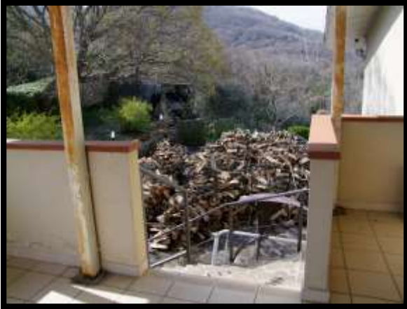
F. 07: ACCESSO ALL'APPARTAMENTO UBICATO AL PIANO 1° (PIANO 2° CATASTALE) IN VIA LEONARDO DA VINCI, N. 16 – MONTAQUILA (IS), P.LLA 165 (NON OGGETTO DI VALUTAZIONE)