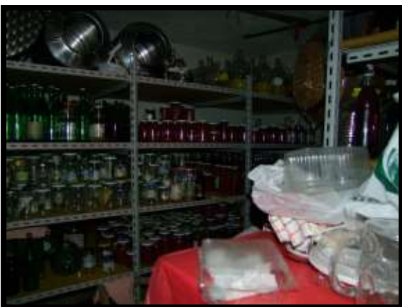
F. 47: INTERNO DEI LOCALI DISPENSA E CANTINA UBICATI AL PIANO SEMINTERRATO 1 (PIANO TERRA CATASTALE) IN VIA LEONARDO DA VINCI, N. 16 – MONTAQUILA (IS), P.LLA 3 SUB. 7 (A/2)