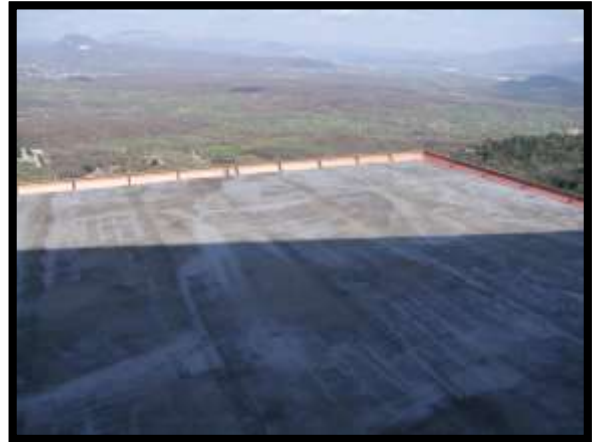
F. 22: TERRAZZO DELL'APPARTAMENTO UBICATO AL PIANO 1° (PIANO 2° CATASTALE) IN VIA LEONARDO DA VINCI, N. 16 – MONTAQUILA (IS), PORZIONE NON ACCATASTATA