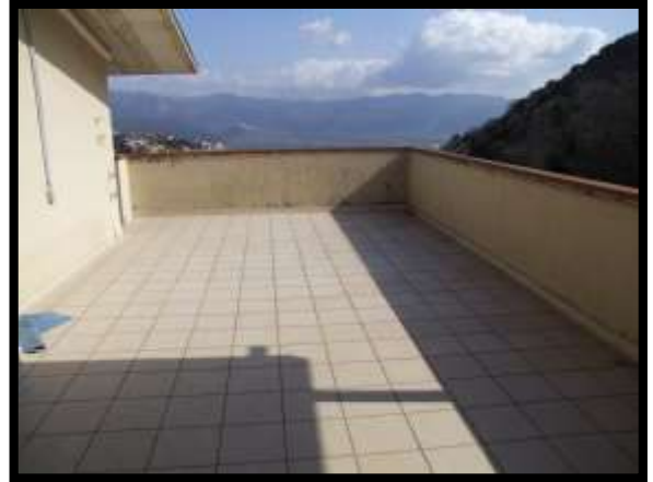
F. 08: ACCESSO ALL'APPARTAMENTO UBICATO AL PIANO 1° (PIANO 2° CATASTALE) IN VIA LEONARDO DA VINCI, N. 16 – MONTAQUILA (IS), P.LLA 165 (NON OGGETTO DI VALUTAZIONE)