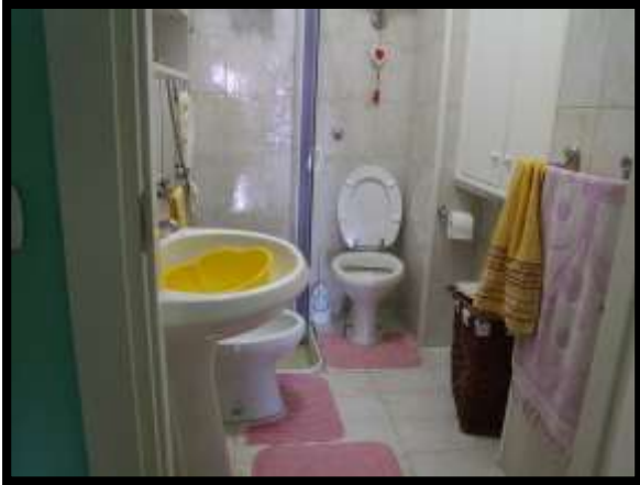
F. 31: INTERNO DELL'APPARTAMENTO UBICATO AL PIANO TERRA (PIANO 1° CATASTALE) IN VIA LEONARDO DA VINCI, N. 16 – MONTAQUILA (IS), P.LLA 3 SUB. 7 (A/2)