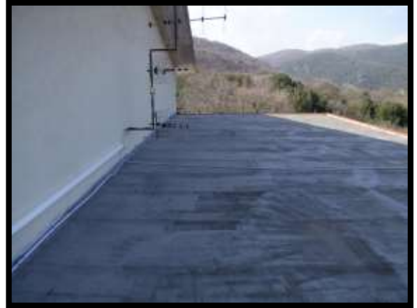
F. 20: TERRAZZO DELL'APPARTAMENTO UBICATO AL PIANO 1° (PIANO 2° CATASTALE) IN VIA LEONARDO DA VINCI, N. 16 – MONTAQUILA (IS), PORZIONE NON ACCATASTATA