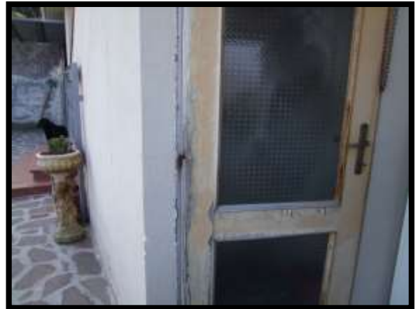
F. 52: INGRESSO DEL RIPOSTIGLIO UBICATO AL PIANO SEMINTERRATO 1 (PIANO TERRA CATASTALE) IN VIA LEONARDO DA VINCI, N. 16 – MONTAQUILA (IS), P.LLA 3 SUB. 7 (A/2)