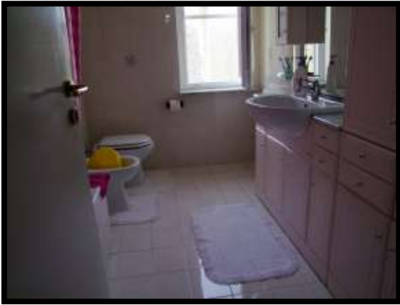
F. 39: INTERNO DELL'APPARTAMENTO UBICATO AL PIANO TERRA (PIANO 1° CATASTALE) IN VIA LEONARDO DA VINCI, N. 16 – MONTAQUILA (IS), P.LLA 3 SUB. 7 (A/2)