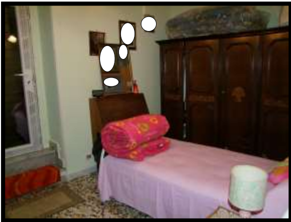
F. 33: INTERNO DELL'APPARTAMENTO UBICATO AL PIANO TERRA (PIANO 1° CATASTALE) IN VIA LEONARDO DA VINCI, N. 16 – MONTAQUILA (IS), P.LLA 3 SUB. 7 (A/2)