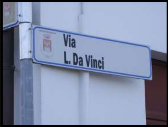
F. 01: ACCESSO AL FABBRICATO PLURIFAMILIARE DA VIA LEONARDO DA VINCI – MONTAQUILA (IS)