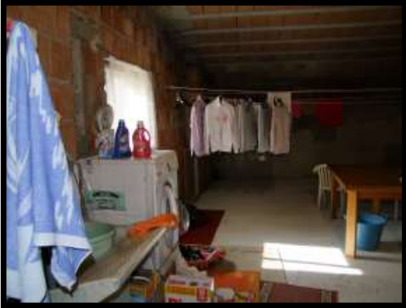
F. 19: INTERNO DELL'APPARTAMENTO UBICATO AL PIANO 1° (PIANO 2° CATASTALE) IN VIA LEONARDO DA VINCI, N. 16 – MONTAQUILA (IS), P.LLA 3 SUB. 7 (A/2)