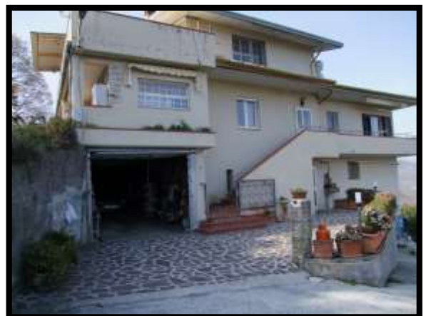
F. 42: ACCESSO AI LOCALI DISPENSA E CANTINA UBICATI AL PIANO SEMINTERRATO 1 (PIANO TERRA CATASTALE) IN VIA LEONARDO DA VINCI, N. 16 – MONTAQUILA (IS), P.LLA 3 SUB. 5 (BENE COMUNE NON CENSIBILE)