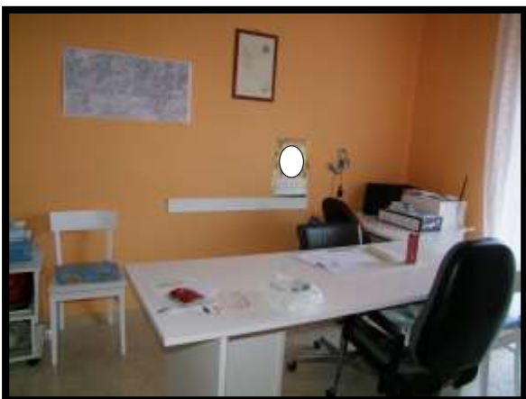
F. 41: INTERNO DELL'APPARTAMENTO UBICATO AL PIANO TERRA (PIANO 1° CATASTALE) IN VIA LEONARDO DA VINCI, N. 16 – MONTAQUILA (IS), P.LLA 3 SUB. 7 (A/2)