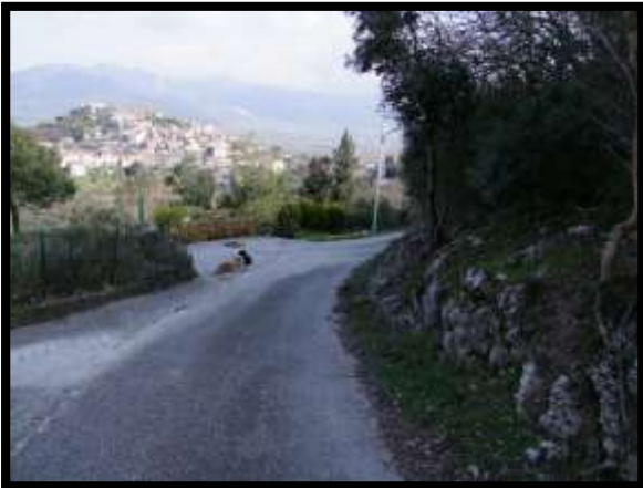
F. 03: ACCESSO AL FABBRICATO PLURIFAMILIARE DA VIA LEONARDO DA VINCI – MONTAQUILA (IS)