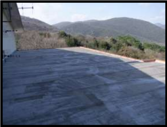
F. 21: TERRAZZO DELL'APPARTAMENTO UBICATO AL PIANO 1° (PIANO 2° CATASTALE) IN VIA LEONARDO DA VINCI, N. 16 – MONTAQUILA (IS), PORZIONE NON ACCATASTATA