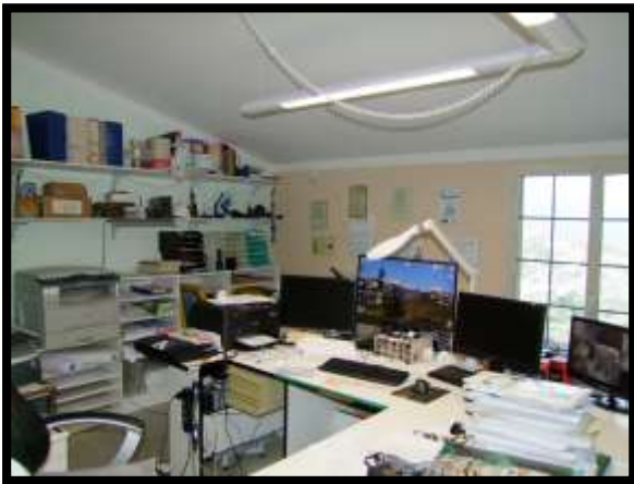
F. 15: INTERNO DELL'APPARTAMENTO UBICATO AL PIANO 1° (PIANO 2° CATASTALE) IN VIA LEONARDO DA VINCI, N. 16 – MONTAQUILA (IS), P.LLA 3 SUB. 7 (A/2)