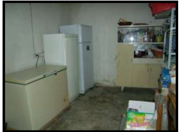
F. 46: INTERNO DEI LOCALI DISPENSA E CANTINA UBICATI AL PIANO SEMINTERRATO 1 (PIANO TERRA CATASTALE) IN VIA LEONARDO DA VINCI, N. 16 – MONTAQUILA (IS), P.LLA 3 SUB. 7 (A/2)