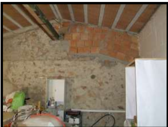
F. 17: INTERNO DELL'APPARTAMENTO UBICATO AL PIANO 1° (PIANO 2° CATASTALE) IN VIA LEONARDO DA VINCI, N. 16 – MONTAQUILA (IS), P.LLA 3 SUB. 7 (A/2)