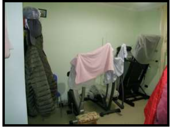
F. 38: INTERNO DELL'APPARTAMENTO UBICATO AL PIANO TERRA (PIANO 1° CATASTALE) IN VIA LEONARDO DA VINCI, N. 16 – MONTAQUILA (IS), P.LLA 3 SUB. 7 (A/2)