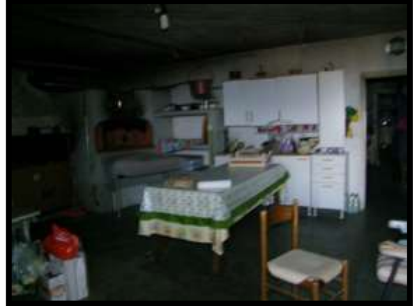
F. 44: INTERNO DEI LOCALI DISPENSA E CANTINA UBICATI AL PIANO SEMINTERRATO 1 (PIANO TERRA CATASTALE) IN VIA LEONARDO DA VINCI, N. 16 – MONTAQUILA (IS), P.LLA 3 SUB. 7 (A/2)