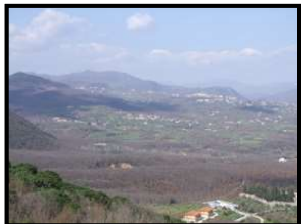
F. 24: VISTA DALL'APPARTAMENTO UBICATA AL PIANO 1° (PIANO 2° CATASTALE) IN VIA LEONARDO DA VINCI, N. 16 – MONTAQUILA (IS)