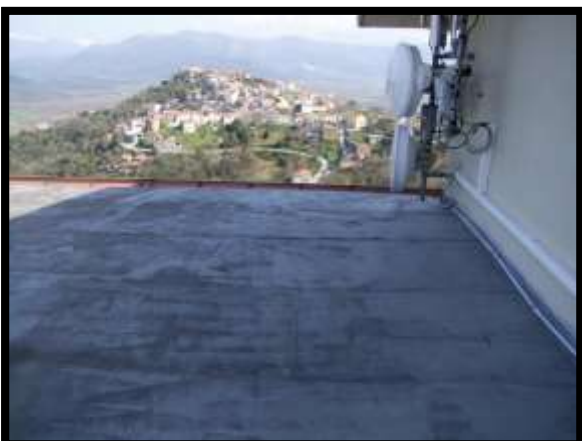
F. 23: TERRAZZO DELL'APPARTAMENTO UBICATO AL PIANO 1° (PIANO 2° CATASTALE) IN VIA LEONARDO DA VINCI, N. 16 – MONTAQUILA (IS), PORZIONE NON ACCATASTATA