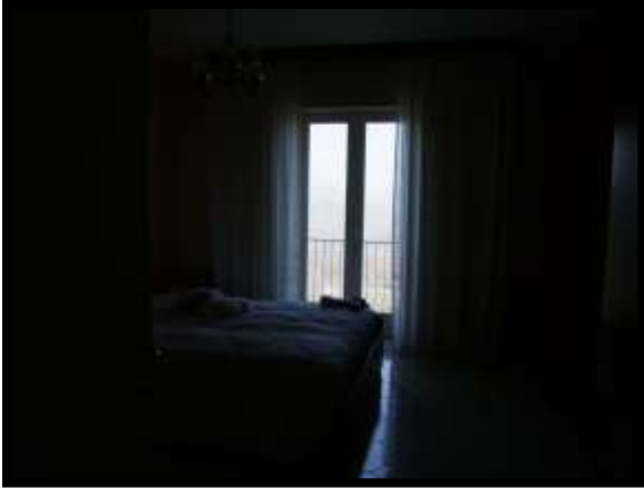
F. 37: INTERNO DELL'APPARTAMENTO UBICATO AL PIANO TERRA (PIANO 1° CATASTALE) IN VIA LEONARDO DA VINCI, N. 16 – MONTAQUILA (IS), P.LLA 3 SUB. 7 (A/2)