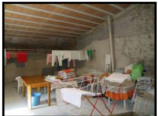
F. 18: INTERNO DELL'APPARTAMENTO UBICATO AL PIANO 1° (PIANO 2° CATASTALE) IN VIA LEONARDO DA VINCI, N. 16 – MONTAQUILA (IS), P.LLA 3 SUB. 7 (A/2)