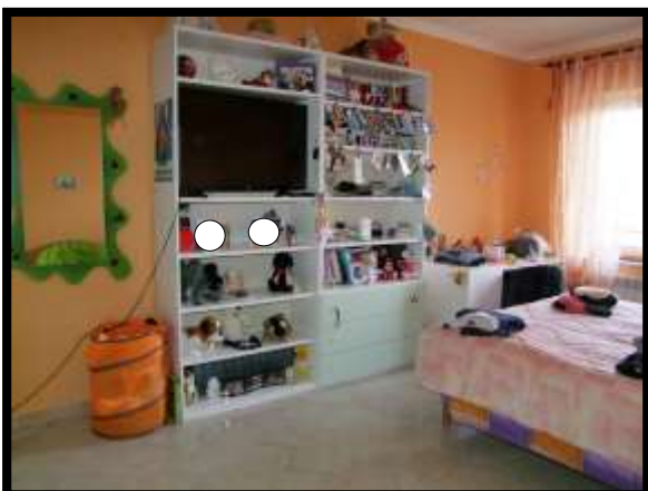
F. 35: INTERNO DELL'APPARTAMENTO UBICATO AL PIANO TERRA (PIANO 1° CATASTALE) IN VIA LEONARDO DA VINCI, N. 16 – MONTAQUILA (IS), P.LLA 3 SUB. 7 (A/2)