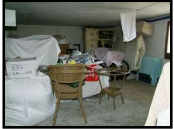
F. 50: INTERNO DEI LOCALI DISPENSA E CANTINA UBICATI AL PIANO SEMINTERRATO 1 (PIANO TERRA CATASTALE) IN VIA LEONARDO DA VINCI, N. 16 – MONTAQUILA (IS), P.LLA 3 SUB. 7 (A/2)