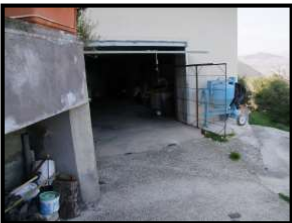
F. 53: INGRESSO DEL GARAGE UBICATO A PIANO SEMINTERRATO 2 (PIANO SEMINTERRATO 1 CATASTALE) IN VIA LEONARDO DA VINCI, N. 16 – MONTAQUILA (IS), P.LLA 3 SUB. 6 (C/6)