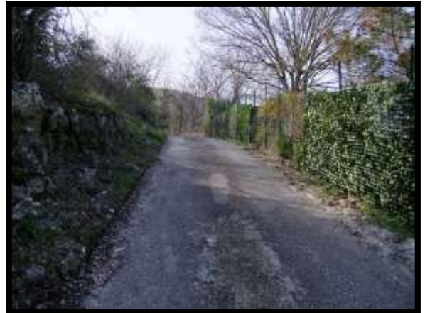
F. 04: ACCESSO AL FABBRICATO PLURIFAMILIARE DA VIA LEONARDO DA VINCI – MONTAQUILA (IS)