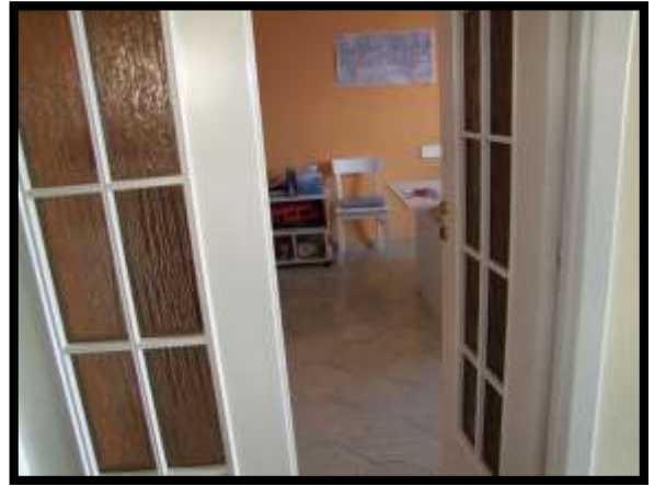
F. 40: INTERNO DELL'APPARTAMENTO UBICATO AL PIANO TERRA (PIANO 1° CATASTALE) IN VIA LEONARDO DA VINCI, N. 16 – MONTAQUILA (IS), P.LLA 3 SUB. 7 (A/2)