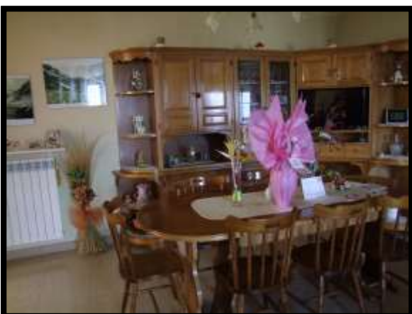
F. 29: INTERNO DELL'APPARTAMENTO UBICATO AL PIANO TERRA (PIANO 1° CATASTALE) IN VIA LEONARDO DA VINCI, N. 16 – MONTAQUILA (IS), P.LLA 3 SUB. 7 (A/2)