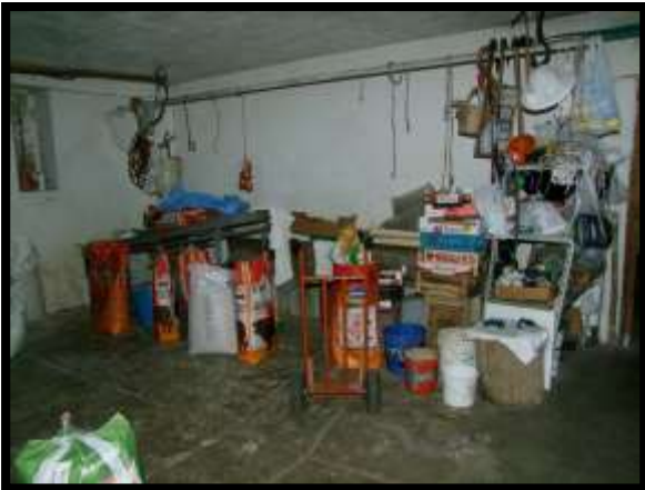
F. 45: INTERNO DEI LOCALI DISPENSA E CANTINA UBICATI AL PIANO SEMINTERRATO 1 (PIANO TERRA CATASTALE) IN VIA LEONARDO DA VINCI, N. 16 – MONTAQUILA (IS), P.LLA 3 SUB. 7 (A/2)