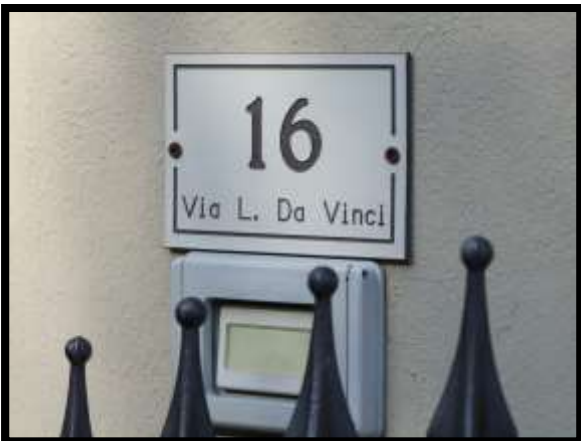
F. 27: INGRESSO DELL'APPARTAMENTO UBICATO AL PIANO TERRA (PIANO 1° CATASTALE) IN VIA LEONARDO DA VINCI, N. 16 – MONTAQUILA (IS), P.LLA 3 SUB. 7 (A/2)