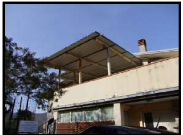
F. 06: FABBRICATO PLURIFAMILIARE UBICATO IN VIA LEONARDO DA VINCI, N. 16 – MONTAQUILA (IS), P.LLA 3 SUB. 6 (C/6) E SUB. 7 (A/2)