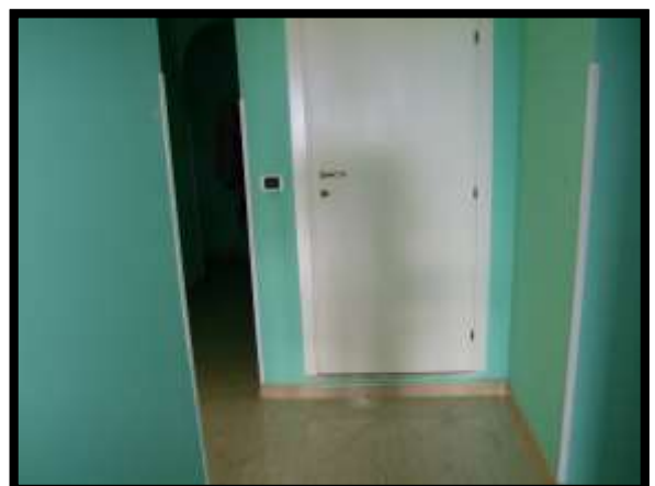
F. 30: INTERNO DELL'APPARTAMENTO UBICATO AL PIANO TERRA (PIANO 1° CATASTALE) IN VIA LEONARDO DA VINCI, N. 16 – MONTAQUILA (IS), P.LLA 3 SUB. 7 (A/2)