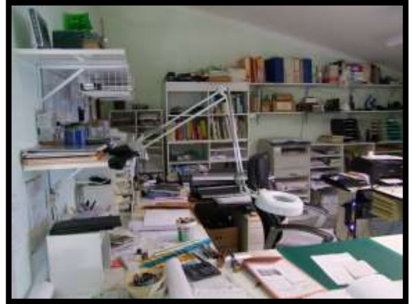
F. 14: INTERNO DELL'APPARTAMENTO UBICATO AL PIANO 1° (PIANO 2° CATASTALE) IN VIA LEONARDO DA VINCI, N. 16 – MONTAQUILA (IS), P.LLA 3 SUB. 7 (A/2)