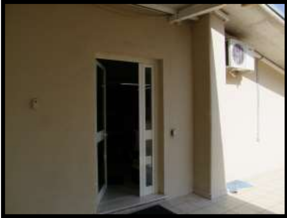
F. 13: INGRESSO DELL'APPARTAMENTO UBICATO AL PIANO 1° (PIANO 2° CATASTALE) IN VIA LEONARDO DA VINCI, N. 16 – MONTAQUILA (IS), P.LLA 3 SUB. 7 (A/2)