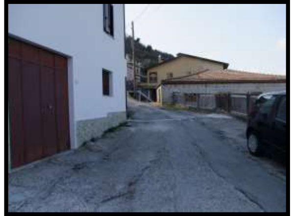
F. 02: ACCESSO AL FABBRICATO PLURIFAMILIARE DA VIA LEONARDO DA VINCI – MONTAQUILA (IS)