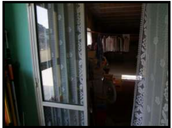
F. 16: INTERNO DELL'APPARTAMENTO UBICATO AL PIANO 1° (PIANO 2° CATASTALE) IN VIA LEONARDO DA VINCI, N. 16 – MONTAQUILA (IS), P.LLA 3 SUB. 7 (A/2)