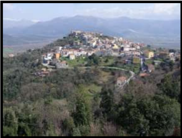
F. 09: VISTA DALL'APPARTAMENTO UBICATA AL PIANO 1° (PIANO 2° CATASTALE) IN VIA LEONARDO DA VINCI, N. 16 – MONTAQUILA (IS)