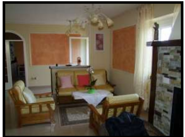
F. 28: INTERNO DELL'APPARTAMENTO UBICATO AL PIANO TERRA (PIANO 1° CATASTALE) IN VIA LEONARDO DA VINCI, N. 16 – MONTAQUILA (IS), P.LLA 3 SUB. 7 (A/2)