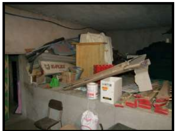
F. 48: INTERNO DEI LOCALI DISPENSA E CANTINA UBICATI AL PIANO SEMINTERRATO 1 (PIANO TERRA CATASTALE) IN VIA LEONARDO DA VINCI, N. 16 – MONTAQUILA (IS), P.LLA 3 SUB. 7 (A/2)