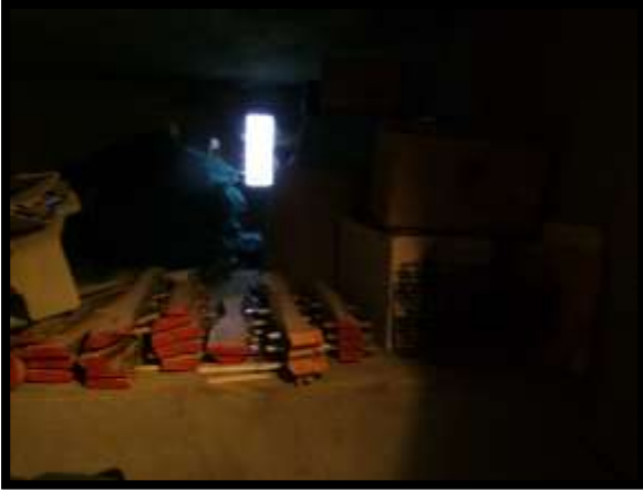
F. 49: INTERNO DEI LOCALI DISPENSA E CANTINA UBICATI AL PIANO SEMINTERRATO 1 (PIANO TERRA CATASTALE) IN VIA LEONARDO DA VINCI, N. 16 – MONTAQUILA (IS), P.LLA 3 SUB. 7 (A/2)