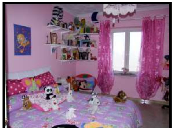
F. 36: INTERNO DELL'APPARTAMENTO UBICATO AL PIANO TERRA (PIANO 1° CATASTALE) IN VIA LEONARDO DA VINCI, N. 16 – MONTAQUILA (IS), P.LLA 3 SUB. 7 (A/2)