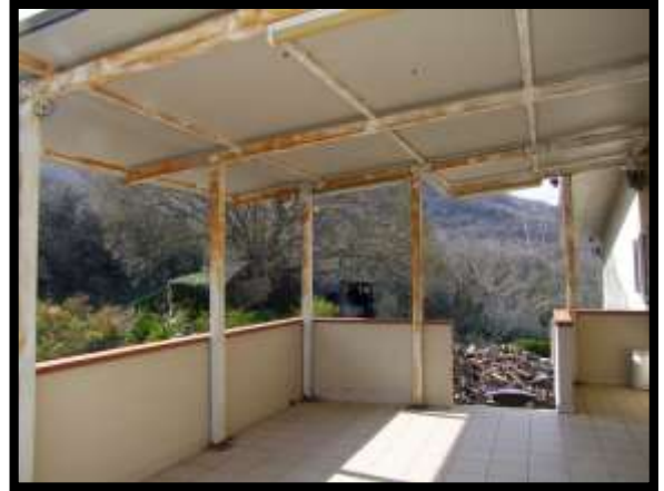
F. 26: ACCESSO ALL'APPARTAMENTO UBICATO AL PIANO 1° (PIANO 2° CATASTALE) IN VIA LEONARDO DA VINCI, N. 16 – MONTAQUILA (IS), P.LLA 165 (NON OGGETTO DI VALUTAZIONE)