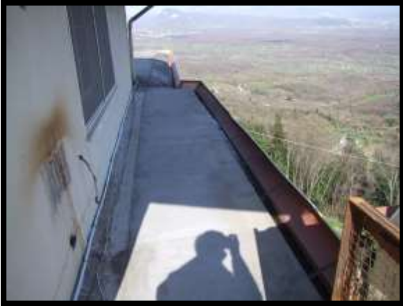
F. 25: TERRAZZO DELL'APPARTAMENTO UBICATO AL PIANO 1° (PIANO 2° CATASTALE) IN VIA LEONARDO DA VINCI, N. 16 – MONTAQUILA (IS), PORZIONE NON ACCATASTATA