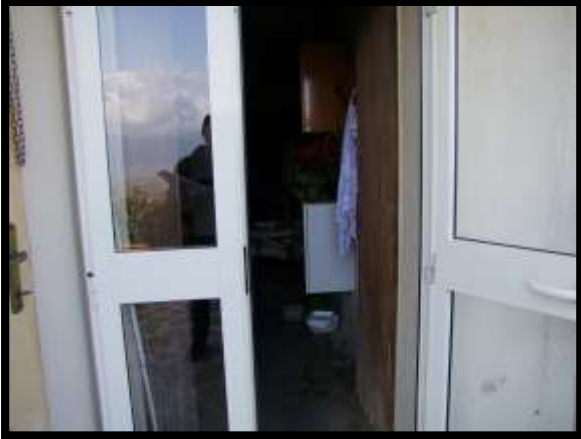
F. 43: INTERNO DEI LOCALI DISPENSA E CANTINA UBICATI AL PIANO SEMINTERRATO 1 (PIANO TERRA CATASTALE) IN VIA LEONARDO DA VINCI, N. 16 – MONTAQUILA (IS), P.LLA 3 SUB. 7 (A/2)