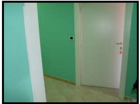
F. 34: INTERNO DELL'APPARTAMENTO UBICATO AL PIANO TERRA (PIANO 1° CATASTALE) IN VIA LEONARDO DA VINCI, N. 16 – MONTAQUILA (IS), P.LLA 3 SUB. 7 (A/2)