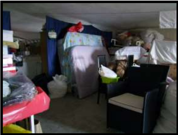
F. 51: INTERNO DEI LOCALI DISPENSA E CANTINA UBICATI AL PIANO SEMINTERRATO 1 (PIANO TERRA CATASTALE) IN VIA LEONARDO DA VINCI, N. 16 – MONTAQUILA (IS), P.LLA 3 SUB. 7 (A/2)