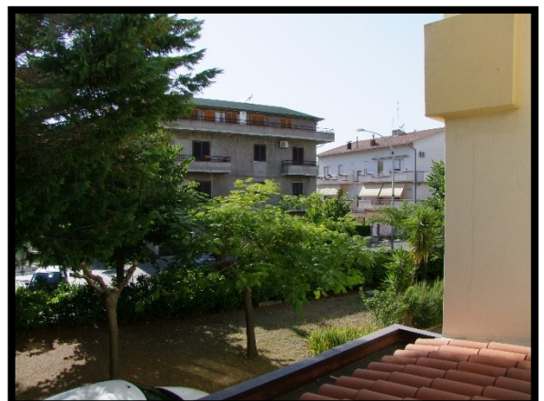
F. 24: VISTA DALL'APPARTAMENTO INTERNO "2" UBICATO AL PIANO 1° IN VIA ALCIDE DE GASPERI, N. 1, SAN SALVO (CH), P.LLA 620 SUB. 10 (A/2)