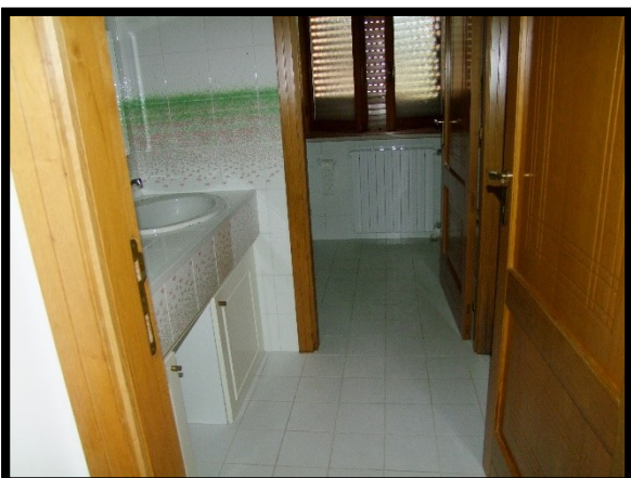
F. 29: INTERNO DELL'APPARTAMENTO INTERNO "2" UBICATO AL PIANO 1° IN VIA ALCIDE DE GASPERI, N. 1, SAN SALVO (CH), P.LLA 620 SUB. 10 (A/2)