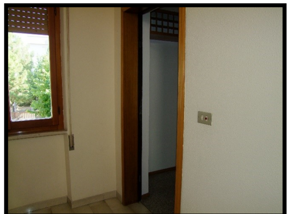
F. 12: INGRESSO DELL'APPARTAMENTO INTERNO "2" UBICATO AL PIANO 1° IN VIA ALCIDE DE GASPERI, N. 1, SAN SALVO (CH), P.LLA 620 SUB. 10 (A/2)