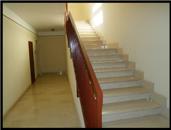
F. 09: ANDRONE COMUNE UBICATO AL PIANO TERRA IN VIA ALCIDE DE GASPERI, N. 1 – SAN SALVO (CH), P.LLA 620