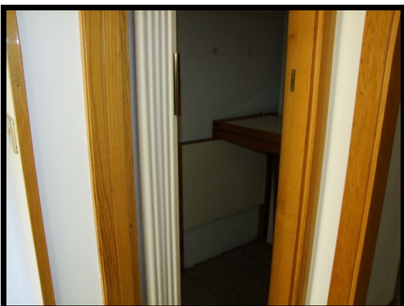
F. 17: INTERNO DELL'APPARTAMENTO INTERNO "2" UBICATO AL PIANO 1° IN VIA ALCIDE DE GASPERI, N. 1, SAN SALVO (CH), P.LLA 620 SUB. 10 (A/2)