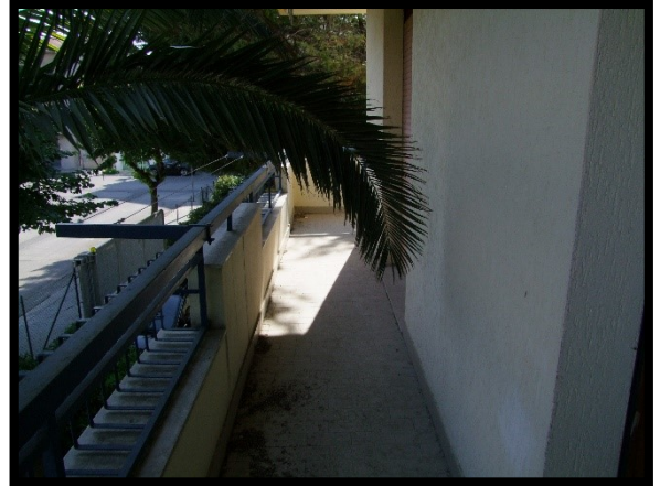
F. 20: BALCONE DELL'APPARTAMENTO INTERNO "2" UBICATO AL PIANO 1° IN VIA ALCIDE DE GASPERI, N. 1, SAN SALVO (CH), P.LLA 620 SUB. 10 (A/2)