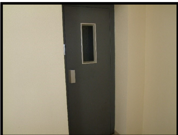
F. 11: ASCENSORE COMUNE UBICATO AL PIANO 1° IN VIA ALCIDE DE GASPERI, N. 1 – SAN SALVO (CH), P.LLA 620