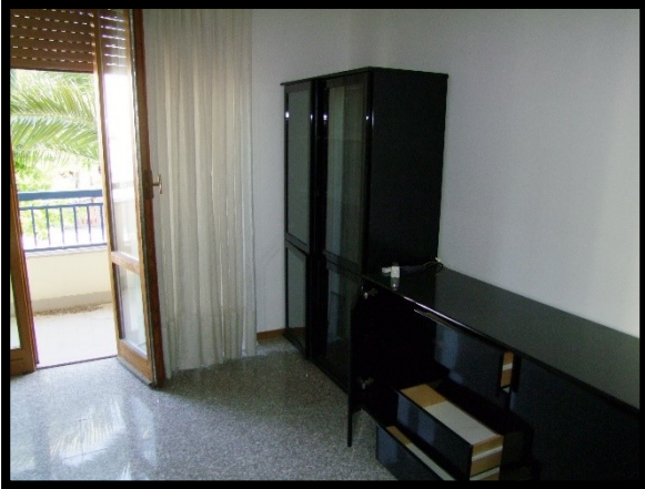
F. 19: INTERNO DELL'APPARTAMENTO INTERNO "2" UBICATO AL PIANO 1° IN VIA ALCIDE DE GASPERI, N. 1, SAN SALVO (CH), P.LLA 620 SUB. 10 (A/2)