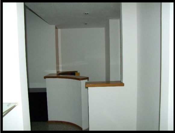
F. 13: INTERNO DELL'APPARTAMENTO INTERNO "2" UBICATO AL PIANO 1° IN VIA ALCIDE DE GASPERI, N. 1, SAN SALVO (CH), P.LLA 620 SUB. 10 (A/2)