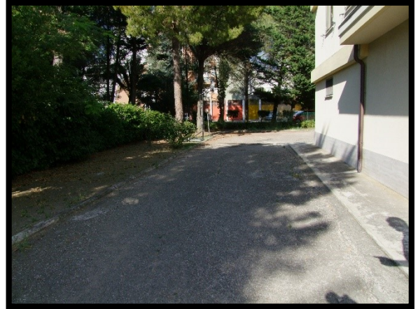
F. 38: ACCESSO AL GARAGE N. "9" UBICATO AL PIANO TERRA IN VIA ALCIDE DE GASPERI, N. 1 – SAN SALVO (CH), P.LLA 620