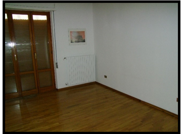
F. 28: INTERNO DELL'APPARTAMENTO INTERNO "2" UBICATO AL PIANO 1° IN VIA ALCIDE DE GASPERI, N. 1, SAN SALVO (CH), P.LLA 620 SUB. 10 (A/2)