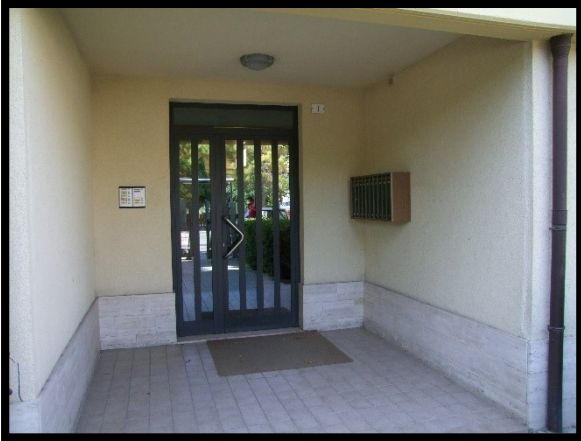
F. 07: INGRESSO COMUNE UBICATO IN AL PIANO TERRA IN VIA ALCIDE DE GASPERI, N. 1 – SAN SALVO (CH), P.LLA 620