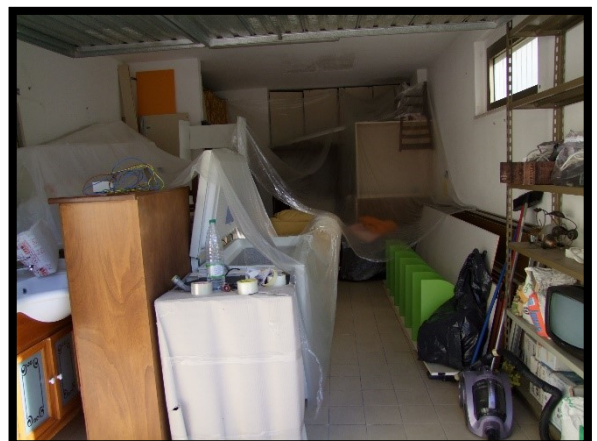
F. 36: INTERNO DEL GARAGE N. "9" UBICATO AL PIANO TERRA IN VIA ALCIDE DE GASPERI, N. 1 – SAN SALVO (CH), P.LLA 620 SUB. 1 (C/6)