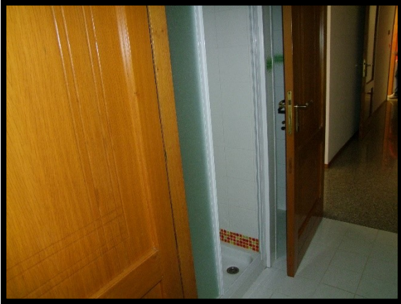
F. 31: INTERNO DELL'APPARTAMENTO INTERNO "2" UBICATO AL PIANO 1° IN VIA ALCIDE DE GASPERI, N. 1, SAN SALVO (CH), P.LLA 620 SUB. 10 (A/2)