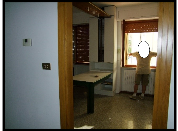
F. 14: INTERNO DELL'APPARTAMENTO INTERNO "2" UBICATO AL PIANO 1° IN VIA ALCIDE DE GASPERI, N. 1, SAN SALVO (CH), P.LLA 620 SUB. 10 (A/2)