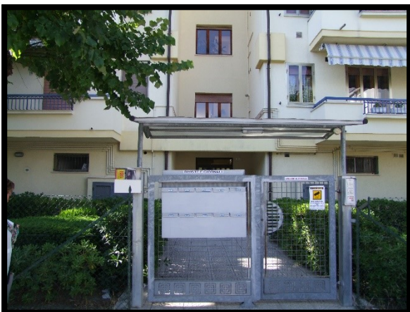
F. 05: FABBRICATO PLURIFAMILIARE UBICATO IN VIA ALCIDE DE GASPERI, N. 1 – SAN SALVO (CH), P.LLA 620