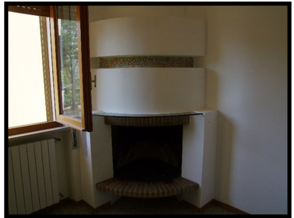
F. 16: INTERNO DELL'APPARTAMENTO INTERNO "2" UBICATO AL PIANO 1° IN VIA ALCIDE DE GASPERI, N. 1, SAN SALVO (CH), P.LLA 620 SUB. 10 (A/2)