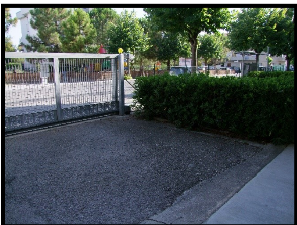
F. 41: AREA PERTINENZIALE COMUNE UBICATA AL PIANO TERRA IN VIA ALCIDE DE GASPERI, N. 1 – SAN SALVO (CH), P.LLA 620