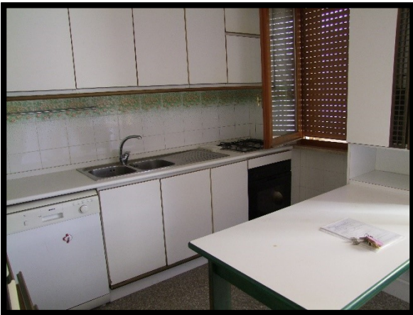
F. 15: INTERNO DELL'APPARTAMENTO INTERNO "2" UBICATO AL PIANO 1° IN VIA ALCIDE DE GASPERI, N. 1, SAN SALVO (CH), P.LLA 620 SUB. 10 (A/2)