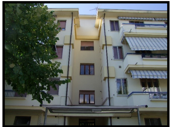
F. 04: FABBRICATO PLURIFAMILIARE UBICATO IN VIA ALCIDE DE GASPERI, N. 1 – SAN SALVO (CH), P.LLA 620