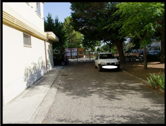
F. 37: ACCESSO AL GARAGE N. "9" UBICATO AL PIANO TERRA IN VIA ALCIDE DE GASPERI, N. 1 – SAN SALVO (CH), P.LLA 620