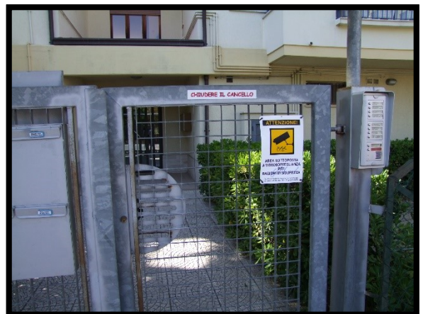
F. 06: INGRESSO COMUNE UBICATO IN AL PIANO TERRA IN VIA ALCIDE DE GASPERI, N. 1 – SAN SALVO (CH), P.LLA 620