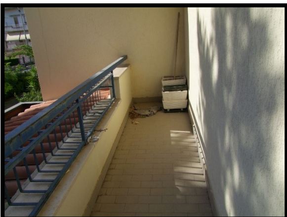
F. 23: BALCONE DELL'APPARTAMENTO INTERNO "2" UBICATO AL PIANO 1° IN VIA ALCIDE DE GASPERI, N. 1, SAN SALVO (CH), P.LLA 620 SUB. 10 (A/2)