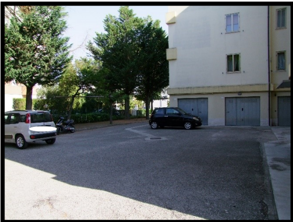
F. 39: AREA PERTINENZIALE COMUNE UBICATA AL PIANO TERRA IN VIA ALCIDE DE GASPERI, N. 1 – SAN SALVO (CH), P.LLA 620