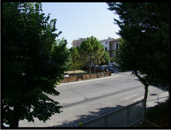
F. 25: VISTA DALL'APPARTAMENTO INTERNO "2" UBICATO AL PIANO 1° IN VIA ALCIDE DE GASPERI, N. 1, SAN SALVO (CH), P.LLA 620 SUB. 10 (A/2)