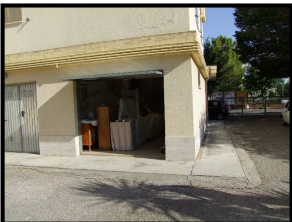
F. 35: INGRESSO DEL GARAGE N. "9" UBICATO AL PIANO TERRA IN VIA ALCIDE DE GASPERI, N. 1 – SAN SALVO (CH), P.LLA 620 SUB. 1 (C/6)