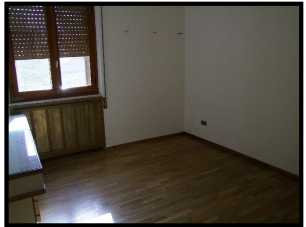
F. 34: INTERNO DELL'APPARTAMENTO INTERNO "2" UBICATO AL PIANO 1° IN VIA ALCIDE DE GASPERI, N. 1, SAN SALVO (CH), P.LLA 620 SUB. 10 (A/2)