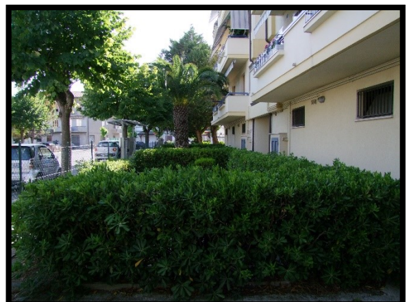
F. 42: AREA PERTINENZIALE COMUNE UBICATA AL PIANO TERRA IN VIA ALCIDE DE GASPERI, N. 1 – SAN SALVO (CH), P.LLA 620