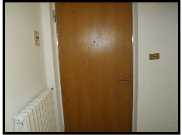
F. 26: INTERNO DELL'APPARTAMENTO INTERNO "2" UBICATO AL PIANO 1° IN VIA ALCIDE DE GASPERI, N. 1, SAN SALVO (CH), P.LLA 620 SUB. 10 (A/2)