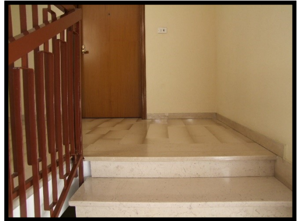
F. 10: ACCESSO ALL'APPARTAMENTO INTERNO "2" UBICATO AL PIANO 1° IN VIA ALCIDE DE GASPERI, N. 1 SAN SALVO (CH), P.LLA 620