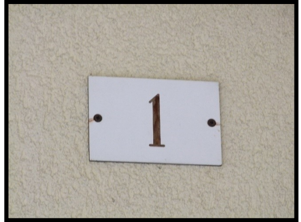
F. 08: INGRESSO COMUNE UBICATO IN AL PIANO TERRA IN VIA ALCIDE DE GASPERI, N. 1 – SAN SALVO (CH), P.LLA 620