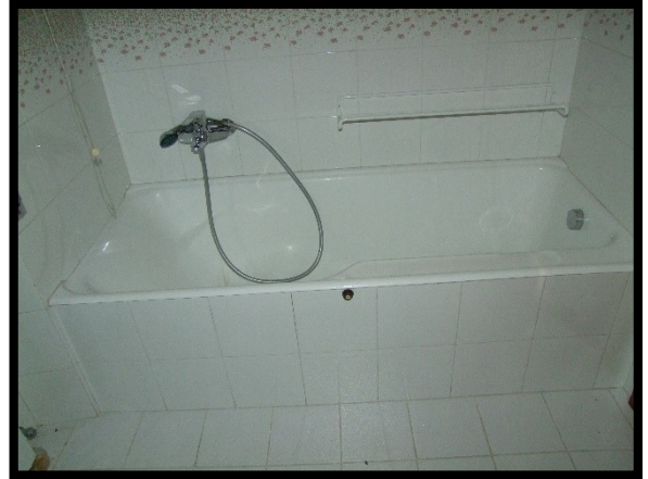
F. 32: INTERNO DELL'APPARTAMENTO INTERNO "2" UBICATO AL PIANO 1° IN VIA ALCIDE DE GASPERI, N. 1, SAN SALVO (CH), P.LLA 620 SUB. 10 (A/2)