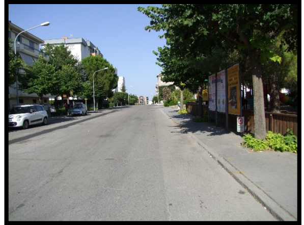
F. 02: ACCESSO AL FABBRICATO PLURIFAMILIARE DA VIALE ALCIDE DE GASPERI – SAN SALVO (CH)