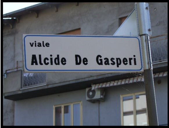
F. 01: ACCESSO AL FABBRICATO PLURIFAMILIARE DA VIA ALCIDE DE GASPERI – SAN SALVO (CH)