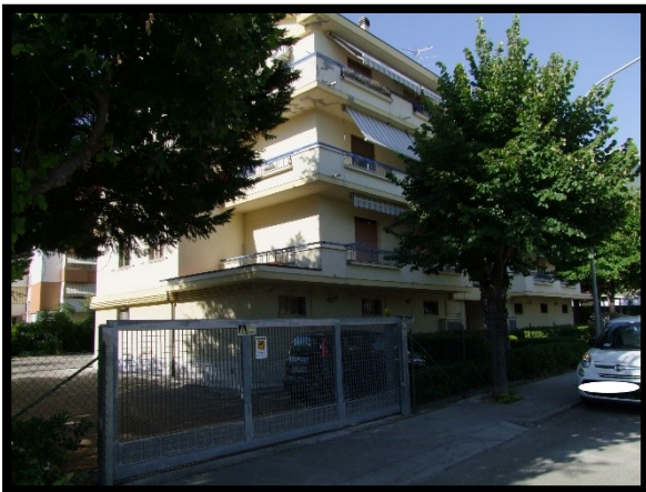
F. 03: FABBRICATO PLURIFAMILIARE UBICATO IN VIA ALCIDE DE GASPERI, N. 1 – SAN SALVO (CH), P.LLA 620