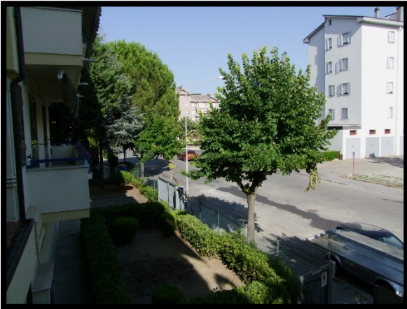
F. 21: VISTA DALL'APPARTAMENTO INTERNO "2" UBICATO AL PIANO 1° IN VIA ALCIDE DE GASPERI, N. 1, SAN SALVO (CH), P.LLA 620 SUB. 10 (A/2)