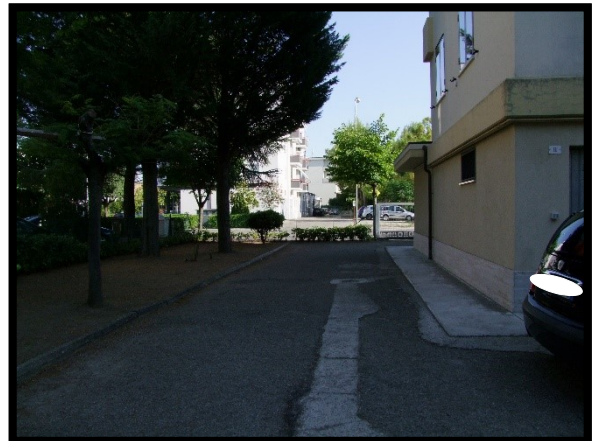
F. 40: AREA PERTINENZIALE COMUNE UBICATA AL PIANO TERRA IN VIA ALCIDE DE GASPERI, N. 1 – SAN SALVO (CH), P.LLA 620