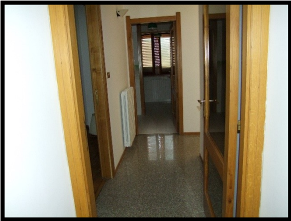
F. 27: INTERNO DELL'APPARTAMENTO INTERNO "2" UBICATO AL PIANO 1° IN VIA ALCIDE DE GASPERI, N. 1, SAN SALVO (CH), P.LLA 620 SUB. 10 (A/2)