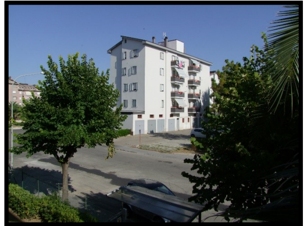
F. 22: VISTA DALL'APPARTAMENTO INTERNO "2" UBICATO AL PIANO 1° IN VIA ALCIDE DE GASPERI, N. 1, SAN SALVO (CH), P.LLA 620 SUB. 10 (A/2)