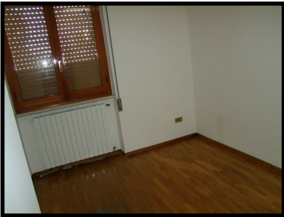
F. 33: INTERNO DELL'APPARTAMENTO INTERNO "2" UBICATO AL PIANO 1° IN VIA ALCIDE DE GASPERI, N. 1, SAN SALVO (CH), P.LLA 620 SUB. 10 (A/2)