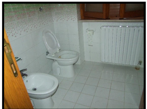
F. 30: INTERNO DELL'APPARTAMENTO INTERNO "2" UBICATO AL PIANO 1° IN VIA ALCIDE DE GASPERI, N. 1, SAN SALVO (CH), P.LLA 620 SUB. 10 (A/2)